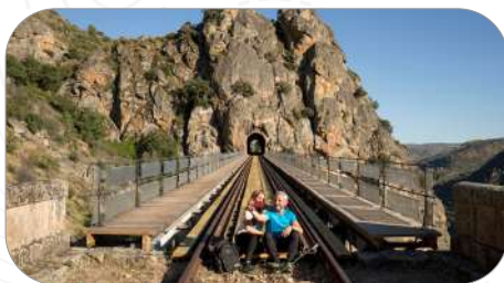
Camino de Hierro, La Fregeneda