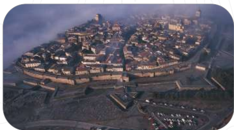
Ciudad Rodrigo, Salamanca

En esta Guía te sugerimos los principales lugares de interés de la ciudad de Salamanca, pero no nos olvidamos de nuestra provincia y sus recursos históricos, naturales y turísticos.